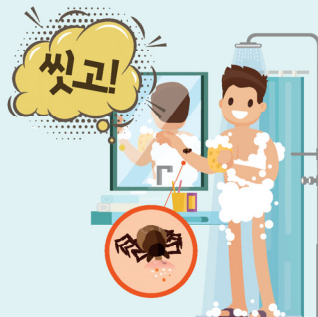
전신 샤워 및 진드기 찾기