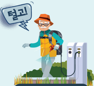
에어건으로 진드기 털기