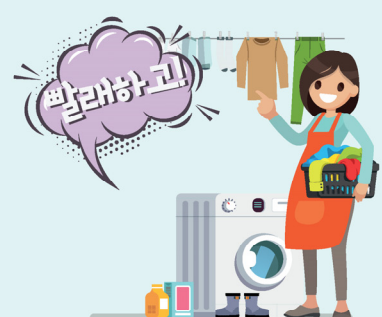
야외복 분리 세탁하기