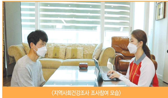
〈지역사회건강조사 조사참여 모습〉