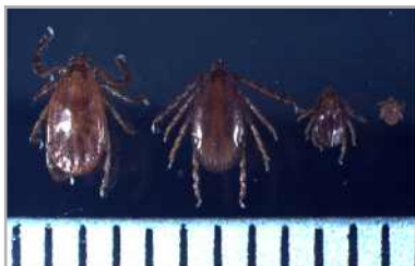
작은소피참진드기 암컷, 수컷, 약충, 유충 순서(눈금한칸: 1mm)

농작업 및 야외활동 시 진드기에 물리지 않도록 예방수칙을 준수해 주시기 바랍니다.