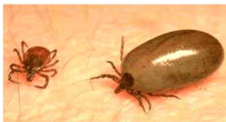
작은소피참진드기 암컷, 흡혈 전(좌)과 흡혈 후(우) 모습