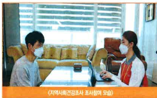
〈지역사회건강조사 조사원 모습〉