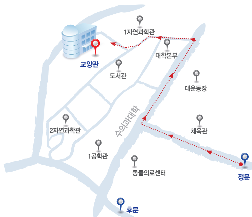
[ 전북대 익산캠퍼스 HACCP 교육장 오시는 길 ]