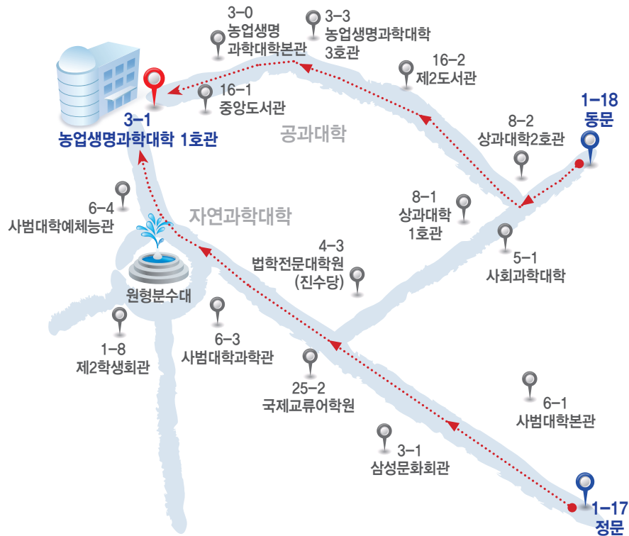
[ 전북대 전주캠퍼스 HACCP 교육장 오시는 길 ]

■ 교육장소 : [전주캠퍼스] 전북 전주시 덕진구 백제대로 567 농업생명과학대학1호관(건물번호3-1) [익산캠퍼스] 전북 익산시 고봉로 79 (변동시 추후공지)