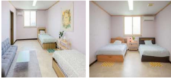
남자 전용 공간