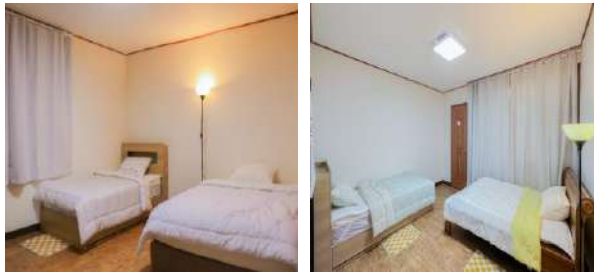
여자 전용 공간