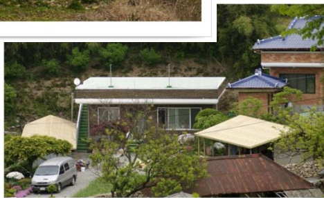
상가 초가지붕 시공