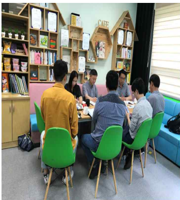
군.청년협의회 주거비용 등 회의개최