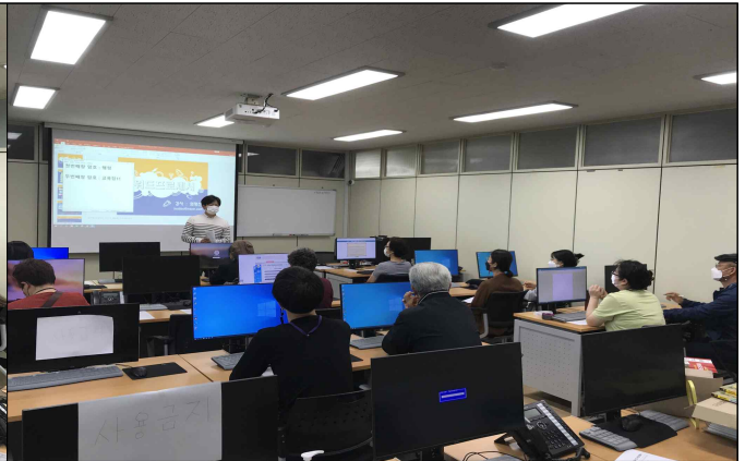
천년배움 1인 1자격증 반(컴활 2급, 워드1급) 운영