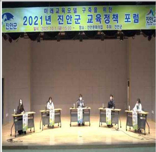
교육정책 포럼 개최(10.1.)