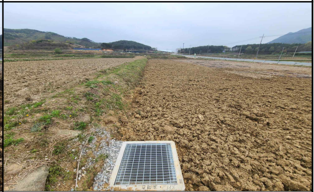
⑥ 사업 완료