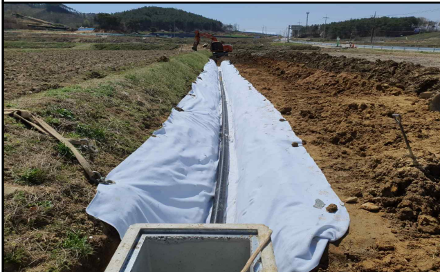
③ 부직포 설치 및 유공관 부설