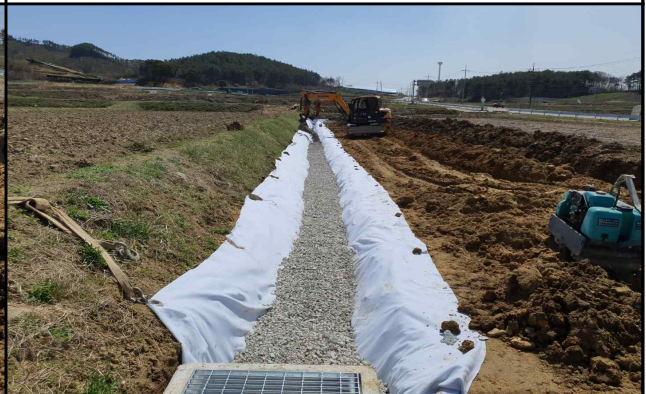
④ 자갈 채움