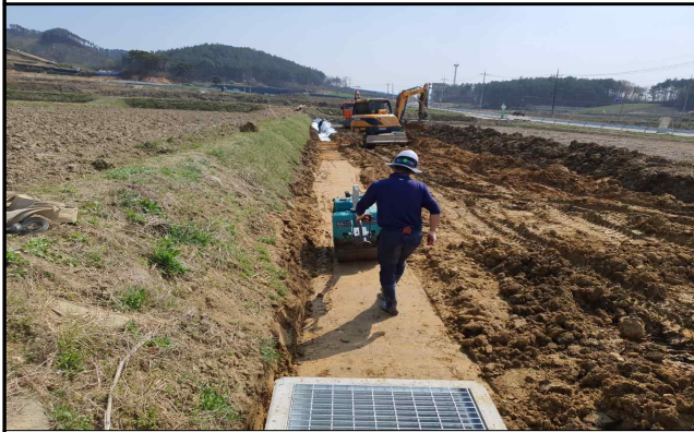
⑤ 되메우기 및 다짐