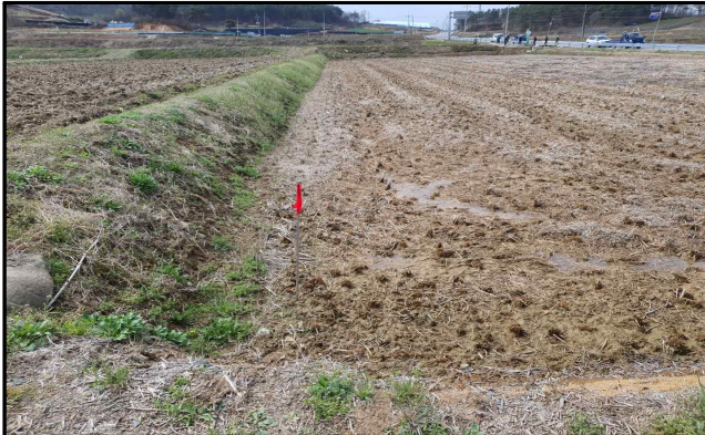
① 사업 착공전