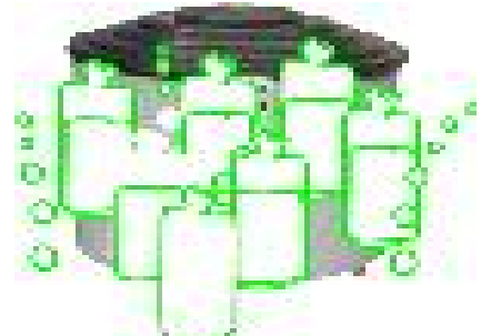
올바른 약제소독 방법