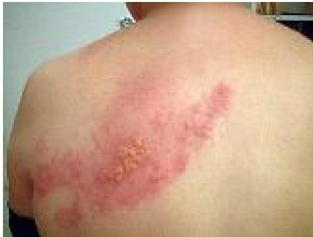
대상포진 발생 예