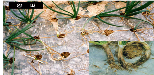
< 양파 흑색썩음균핵병 >