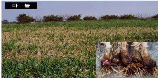
< 마늘 흑색썩음균핵병 >